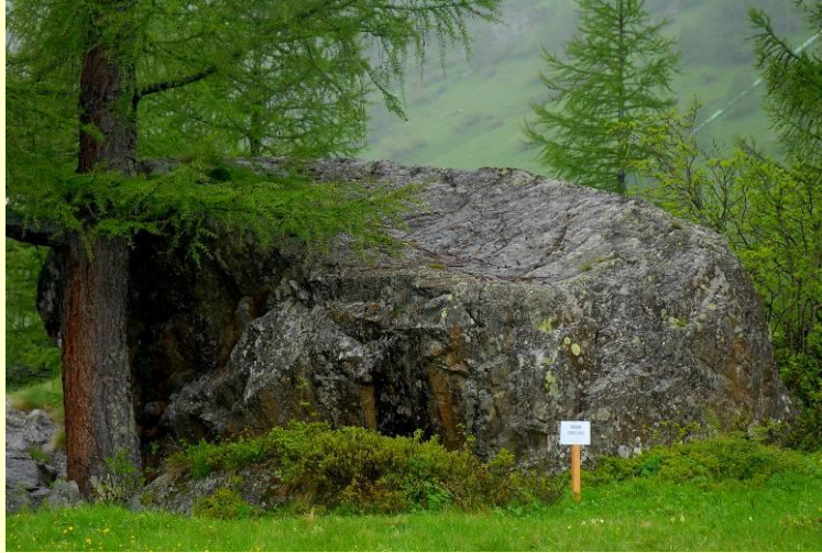
Quasi tutti i massi principali sono stati catalogati, questo si chiama "Rosso Crociato".