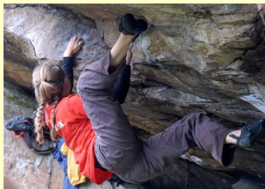
Alé...però, tosti i tetti di "All'acqua" !