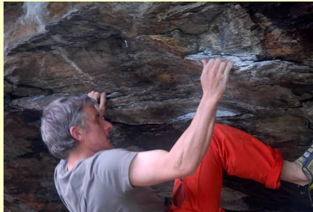
Cecco passa sempre dove qualcun altro ha dovuto cedere...