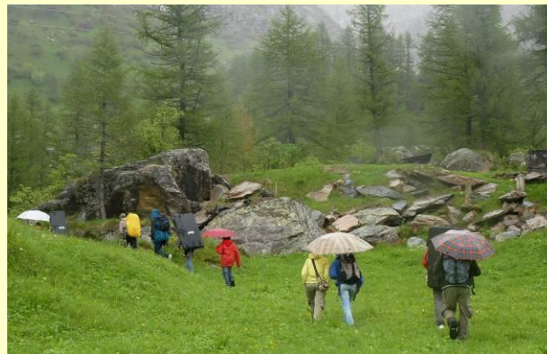
Sotto una leggera pioggia ci si avvia verso i primi massi