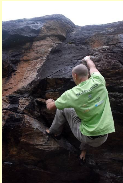
Val di Mello ? ...no, Alpe Devero !