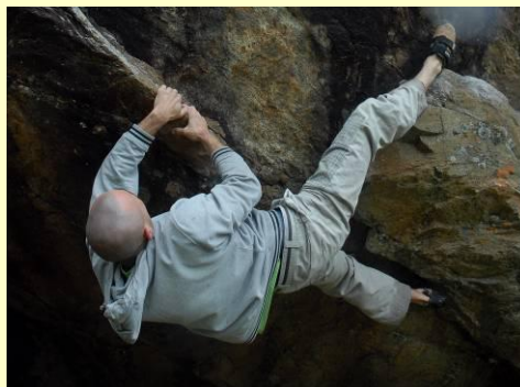
Concentrandosi sui lati a strapiombo, si arrampica al riparo dalla pioggia !