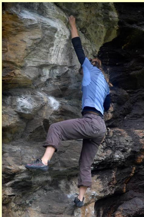
La roccia di Devero è un bel serpentino solido.