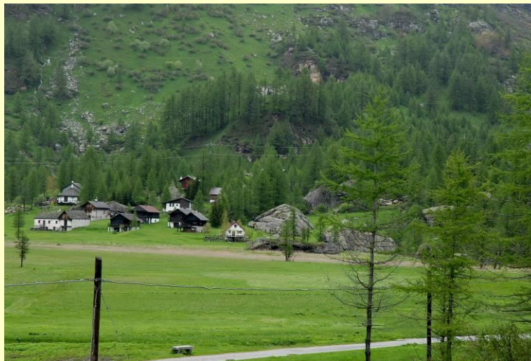
La conca dell'Alpe Devero a quota 1600 m. La zona dei massi da dietro il rifugio del CAI Gallarate verso il Pian della Rossa.