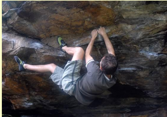
Le possibilità di nuovi massi e varianti sono pressoché infinite.