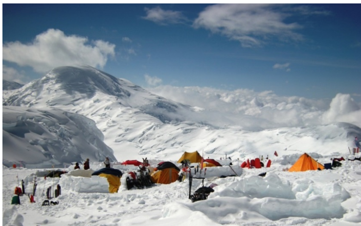
campo 4 dek Denali, West Buttress, Alaska

Su web: http://dolomitiemergency.it/condizioni-general-di-assicurazione/